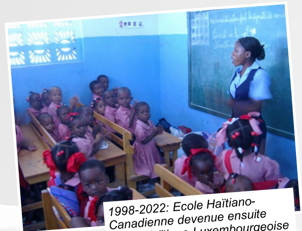
1998-2022: Ecole Haïtiano-Canadienne devenue ensuite Ecole Haïtiano-Luxembourgeoise