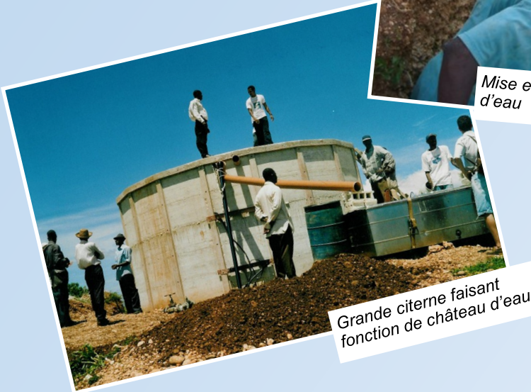
Grande citerne faisant fonction de château d'eau