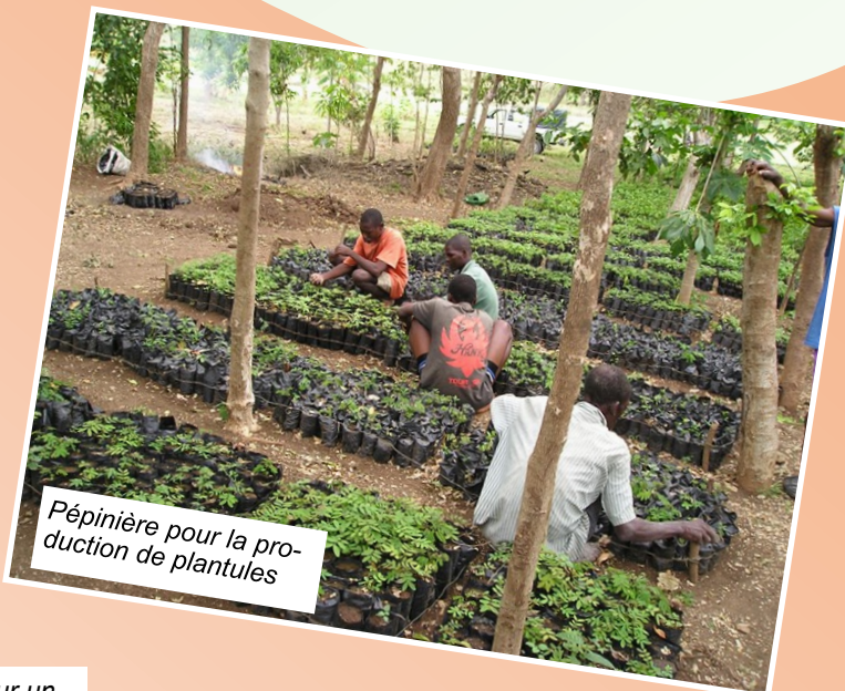
Pépinière pour la pro- duction de plantules