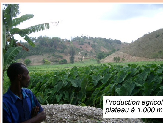
Production agricole sur un plateau à 1.000 m d'altitude