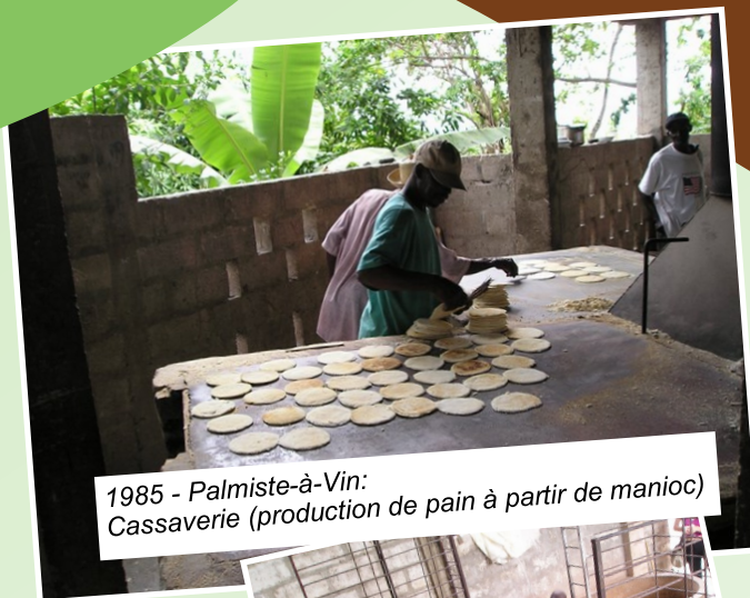
1985 - Palmiste-à-Vin: Cassaverie (production de pain à partir de manioc)