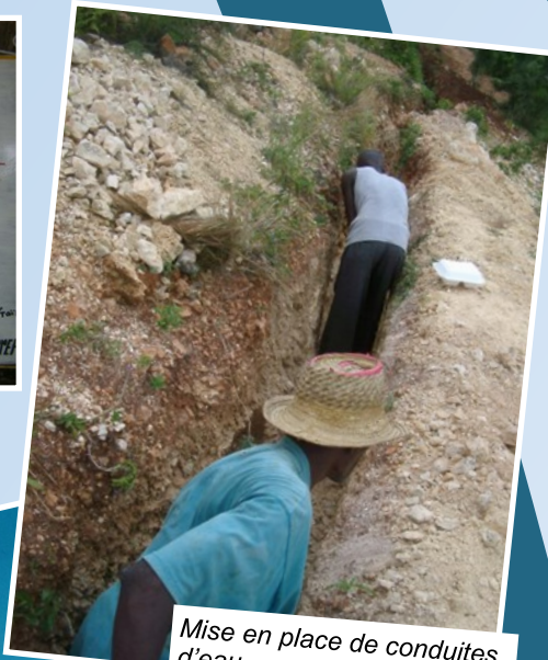
Mise en place de conduites d'eau