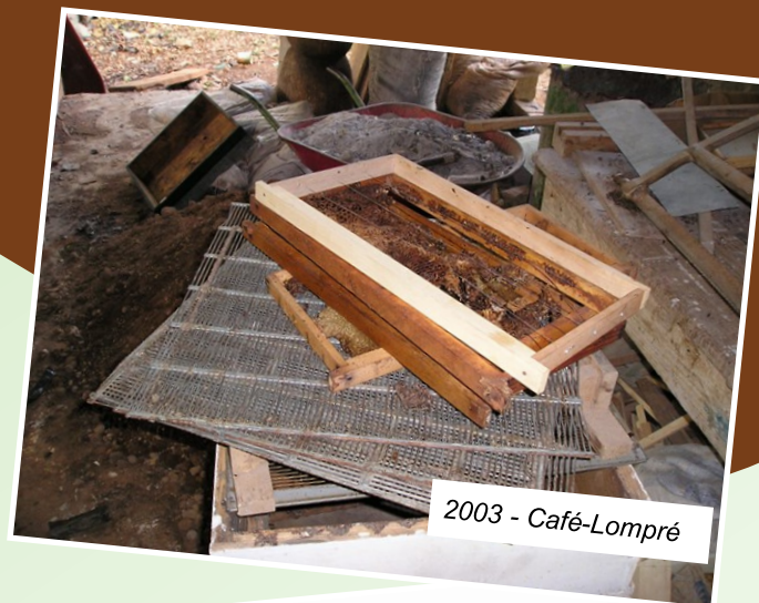
2003 - Café-Lompré