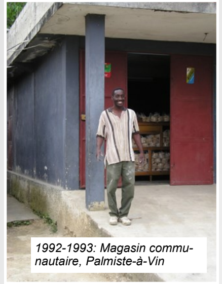
1992-1993: Magasin communautaire, Palmiste-à-Vin