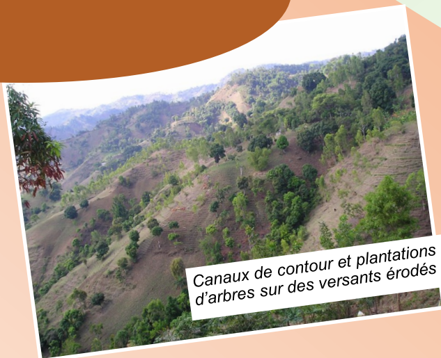
Canaux de contour et plantations d'arbres sur des versants érodés