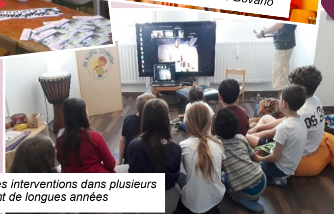
D'innombrables interventions dans plusieurs écoles pendant de longues années