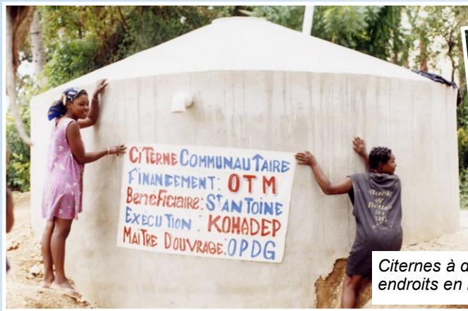
Citernes à divers endroits en Haïti