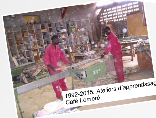
1992-2015: Ateliers d'apprentissage, Café Lompré