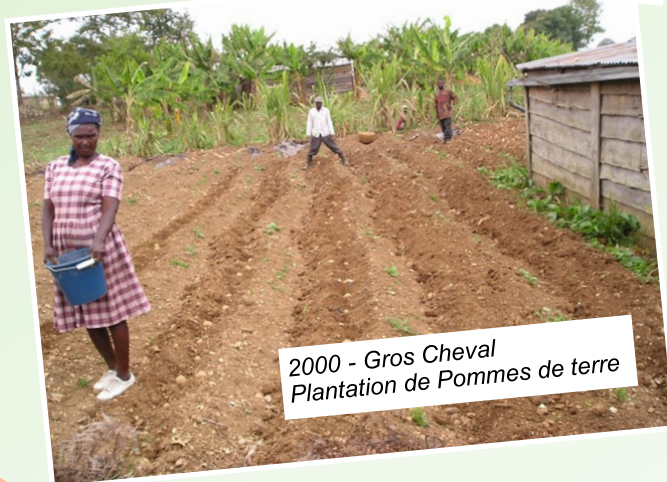
2000 - Gros Cheval Plantation de Pommes de terre