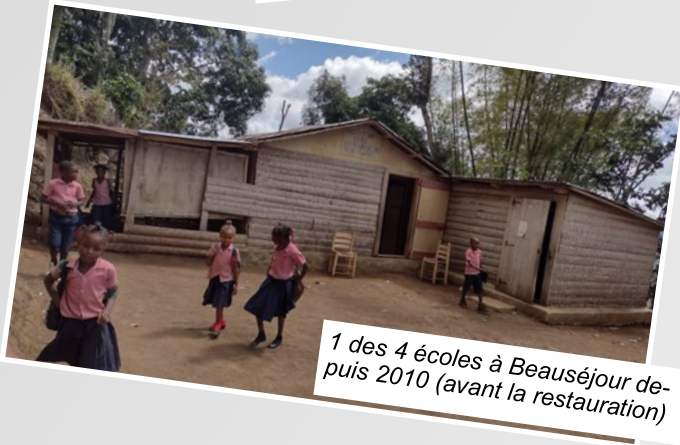
1 des 4 écoles à Beauséjour depuis 2010 (avant la restauration)