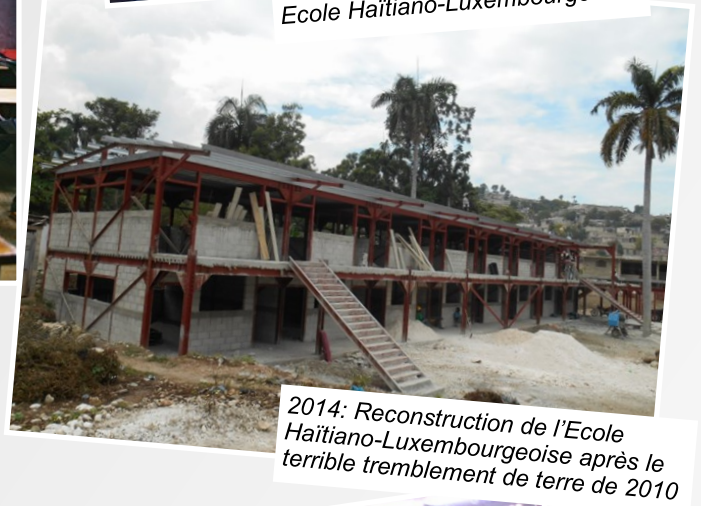
2014: Reconstruction de l'Ecole Haïtiano-Luxembourgeoise après le terrible tremblement de terre de 2010