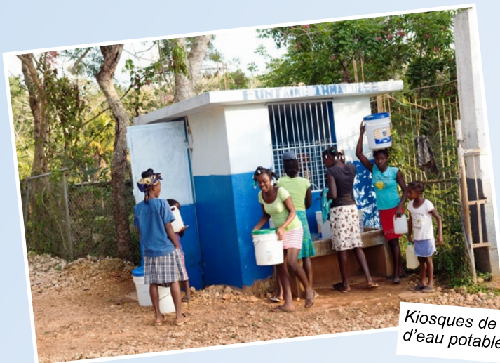
Kiosques de distribution d'eau potable